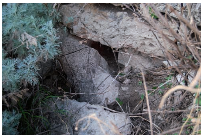
Architrave sull'ingresso alla camera interna

di sopra del livello dell'ingresso; non si osserva quindi la presenza di nicchie, che tuttavia non si escludono ancora sepolte. A m 1,50 dall'attuale calpestio è ancora ben visibile alle pareti una risega circolare, sulla quale doveva poggiare l'impiantito di legno che costituiva la pavimentazione di una camera superiore, come nel noto nuraghe Oes di Giave. L'accesso al vano superiore avveniva regolarmente dalla scala partente dal lato sinistro dell'andito e della quale si osserva ancora parte della spalliera interna nel lato Est; la camera superiore (del diametro di m 3,60 circa) residua solo in alcuni tratti e per appena due filari di altezza: si raccordava al vano della scala tramite un breve corridoio forse non in asse con quello sottostante di ingresso.