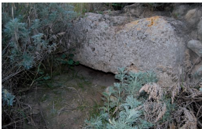
Architrave sull'ingresso interrato

Del tratto finale del corridoio, interamente sepolto, affiora soltanto il vano di scarico sull'architrave dell'ingresso che sfocia nella camera; quest'ultima è circolare (diametro m 3,10 al piano di interro) ed ingombra di macerie al