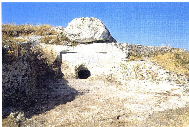
Fig. 2 - Necropoli di Sa Figu (Ittiri - SS) - Tomba IV.

erano presenti molte più tombe, oggi distrutte e sepolte e di cui affiorano appena le tracce.