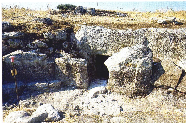
Fig. 1 - Necropoli di Sa Figu (Ittiri - SS) - Tomba II.

La necropoli di "Nuraghe Sa Figu" venne segnalata, per la prima volta, da Ercole Contu, che nel 1961 diede notizia della presenza di quattro tombe, già violate in antico , scavandone due, la I e la III 5 . Un'altra tomba (la V) venne segnalata sempre da E. Contu nel 1978 6 , mentre altre due tombe (la VI e la VII), sono state scoperte dal Dott. Salvatore Merella nel 1994 7 . Attualmente, dunque, la consistenza della necropoli è di almeno sette ipogei, ma in origine